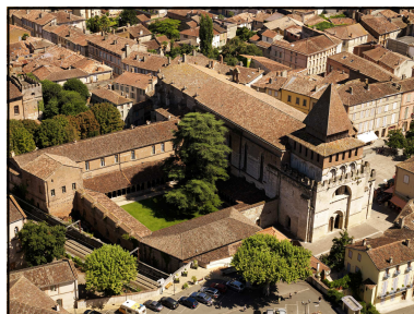
Abbaye de Moissac—vue aérienne