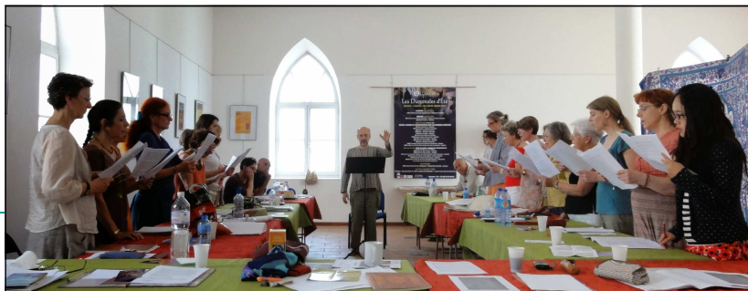
Chœur du CIRMA—Diagonales d'été 2012