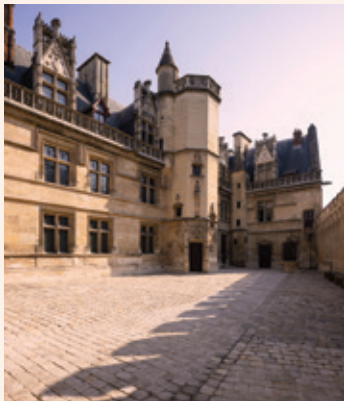
Musée de Cluny musée national du Moyen Âge Paris

Concert Jérusalem dans l'imaginaire liturgique - 18 novembre 2023