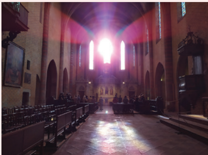
Moissac, l'abbatiale à la 3 ème heure le 25/07/22

Pour clore l'année, sera créée une symphonie composée spécialement pour l'orchestre de l'École de Musique de Moissac, œuvre qui fédérera les énergies musicales qui germent à Moissac. Le 16 décembre, ces énergies s'épanouiront sous les voutes de l'Abbatiale à l'occasion des fêtes de Noël rassemblant toute la cité autour de l'embrasement du clocher de l'abbaye.