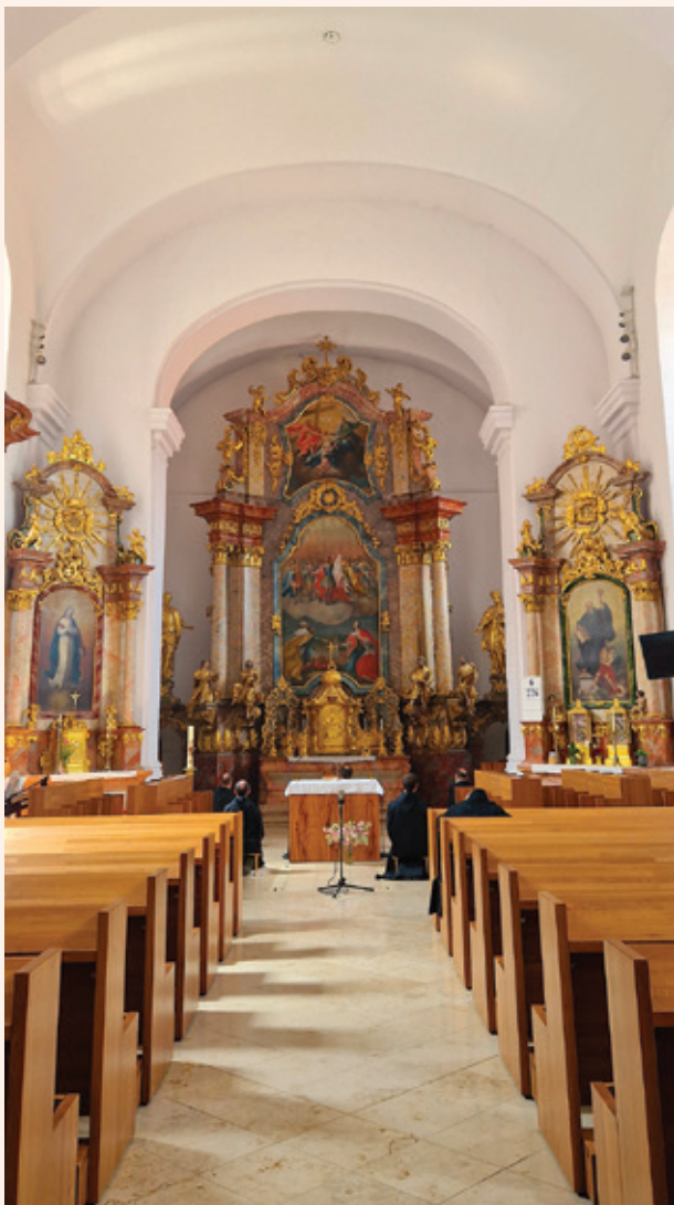
Monastère de Bakonybel 27/05/2023

The old Roman song occupies a central position in the history of music. Upstream, he gives us the key to the filiation between the song of the Temple of Jerusalem and the heritage of Greek music. Downstream, it allows us to follow and understand the treasures of the Koranic cantillation. Apart from some extremely restricted musicological circles, this repertoire is now unknown to musicians, clergymen and the public. Yet he gives us the oldest version of Greco-Latin music of late antiquity and represents the missing link between Byzantine chant, Coptic chant, Armenian chant, Syriac chant, Arabic music and Western music.