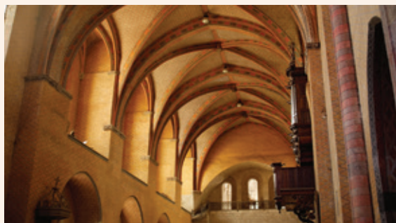
Abbatiale, orgue Cavaillé Coll et orgue roman

Moissac (Abbatiale) Symphonie moissagaise de Marcel Pérès ; Création Mondiale avec l'École Municipale de Musique de Moissac dans le cadre des festivités de Noël - 16 décembre 2023 - 20h