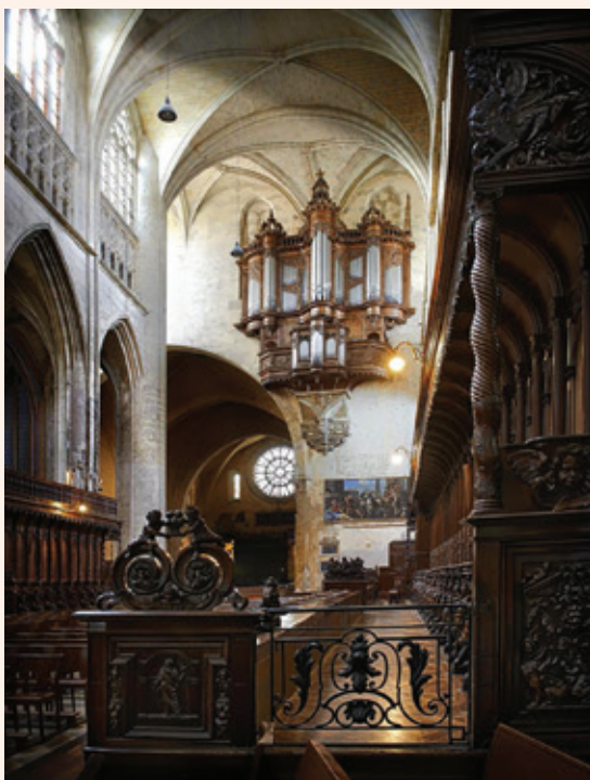
Grand-Orgue, Cathédrale St-Etienne de Toulouse