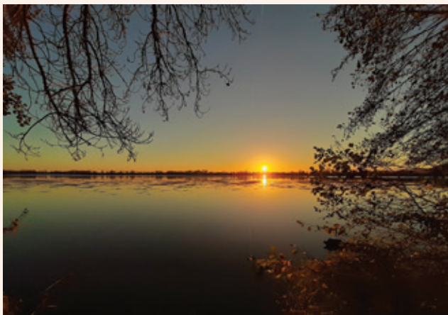
Moissac, berges du Tarn

Cette symphonie a été créée sur mesure pour Moissac en utilisant les ressources générées par tous ceux qui veulent vivre la musique, la connaître, apprendre à la créer, à la diffuser dans l'espace et le temps. L'école de musique de Moissac est la ressource idéale pour incarner une telle démarche. C'est pourquoi nous avons décidé de composer une symphonie qui fera éclater dans l'espace de l'église abbatiale toutes les énergies musicales que renferme cette école. Rencontre entre un monument, une mémoire musicale ancestrale que nous explorons depuis longtemps et les immenses capacités que renferme l'enseignement musical prodigué à Moissac