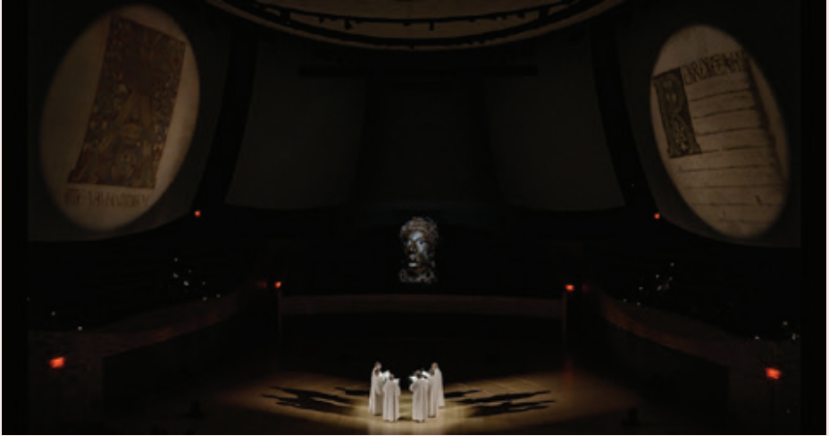
Stanford, Bing Concert Hall, 10/02/23

This year 2023 opens the fifth decade of the foundation of ensemble Organum and promises to be exceptional. Exceptional for the scope of our work, in Europe, in the United States, in Colombia, where we continue our research on the musical archives of the Cathedral of Bogota.