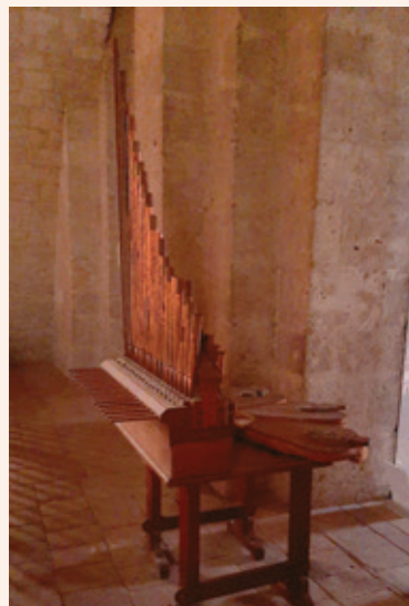
Orgue Roman, Abbatiale de Moissac

Les traditions monodiques et polyphoniques d'Aquitaine - 11 novembre 2023