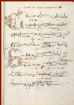
Requiem ; Occo Codex XV e s. ms IV922 f134r