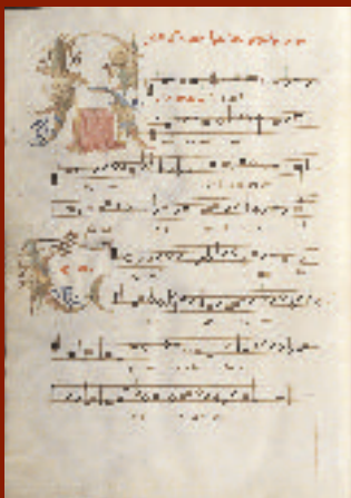
Requiem ; Occo Codex XV e s. ms IV922 f133v