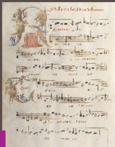
Requiem de Févin ms IV 922 fl133v

Tous les ans, à la même période, nous offrons ce rendez-vous à Moissac pour ceux qui veulent entrer dans cette période particulière de l'année aux harmonies d'un grand requiem polyphonique du XV e s.. Cette année, nous étudierons le Requiem de Antoine Févin qui, bien qu'encore inconnu, constitue un monument de l'histoire de la musique. Composé à la toute fin du XV e s., quelques dizaines d'années après celui de Iohannes Ockeghem, il représente la synthèse parfaite entre la tradition du plain-chant que développèrent les franco flamands dès le XIII e s. et la haute technicité polyphonique qui fit la renommée des ces chantres venus du nord qui répandirent leur art dans toute l'Europe.