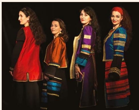
Ensemble les Balkanes

16H : Quatuor Balkanes - 20 ans de polyphonies bulgares a capella - abbatiale**