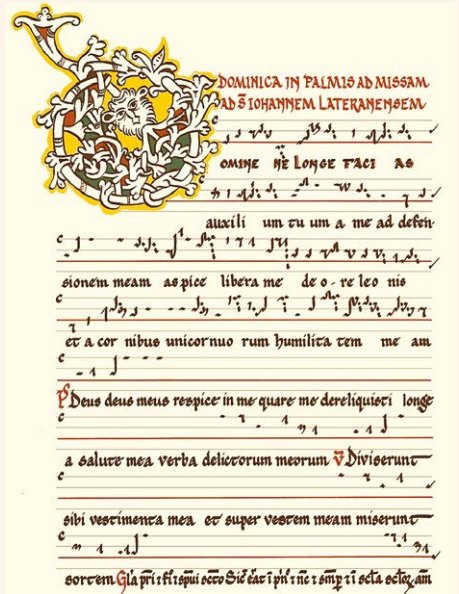
Chant vieux romain XI e s. - Publication du CIRMA