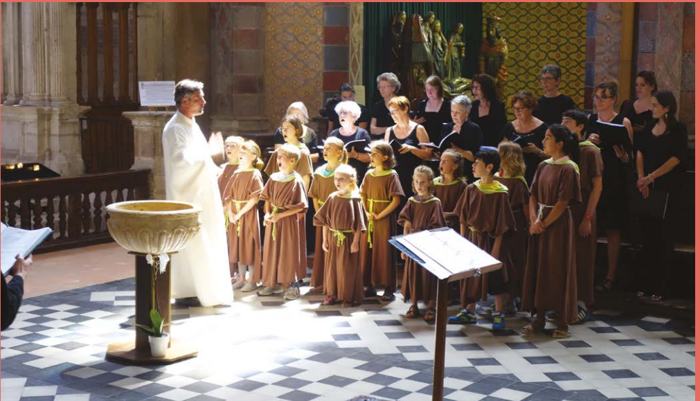
Chœur enfants et adultes

- Des éditions musicales dans le cadre du programme Scriptorium, transcriptions en notation originale de manuscrits du Moyen Âge.