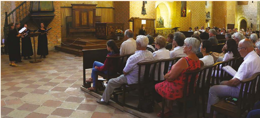
Ensemble Organum - Occitania - abbatale de Moissac, été 2016

CONCERT 4 NOVEMBRE : Cluny, chœur du CIRMA,