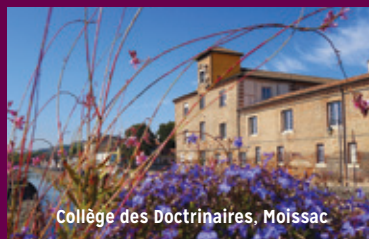
Collège des Doctrinaires, Moissac

L'Ensemble Organum-CIRMA reçoit le soutien du ministère de la culture et de la communication (Drac Occitanie) de la Région Occitanie/ Pyrénées-Méditerranée, du département Tarn-et-Garonne et de la ville de Moissac et la Société Générale.