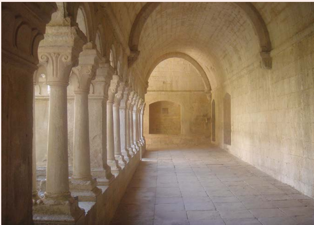
Sénanque, le cloître

Depuis Juillet 2002, Moissac est devenu un lieu singulier qui offre, à ceux qui aiment la musique et souhaitent en découvrir l'essence, la possibilité de se plonger à la source même de l'acte musical, grâce à la Grande Journée de l'Improvisation dans les Musiques Anciennes qui commence à l'aube et se termine au cœur de la nuit.